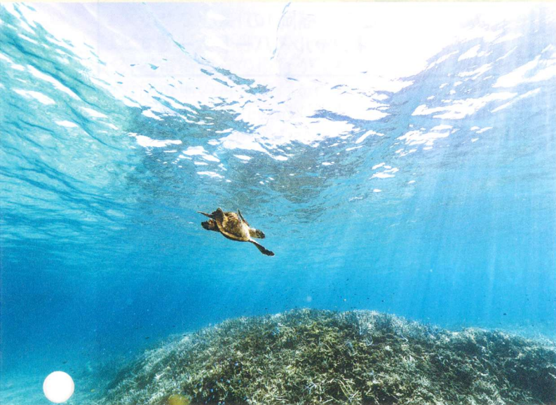
沖縄の海とウミガメ (沖縄県)