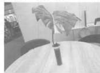
ランプ、花瓶として複数の機能を有するポータブルテーブルランプ「BOUQUET(ブーケ)」(Magis Japan)

「LIVING & DESIGN」と「第94回東京 インターナショナル・ ギフト・ショー秋202 2」が同時開催されたこ とで、それぞれが持つネ ットワークを駆使した相 乗効果を発 揮。初開催 となった今 回は、例えはテレワーク で視線を切って集中して 仕事に取り組みたい人に も最適で、ホームユース も想定できる。