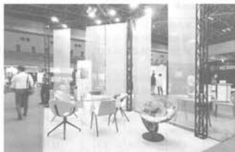
LIVING & DESIGN

住まいと暮らしの国際 見本市「LIVING & DESIGN」が9月7 日から9日までの3日 間、東京ビッグサイト(東 京都江東区)で開催され た。