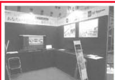
3D住宅プレゼンCAD「Walk in home Plus」他、最新ITツールを出品(安心計画)