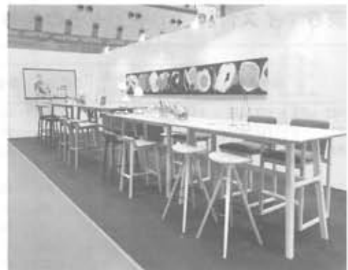
ハイチェア、ハイスツールを取り入れた生活とワークスタイルを提案(カンディハウス)

今回展では、世 界からホームユ ーだけでなく、コ ントラクトともに 対応可能な家具、建材、 住宅設備、インテリアメ ーカーなど23社が出展。 総合プロデューサーに喜 多氏を迎え、世界レベル の空間演出で会場を構成 した。