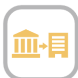
住宅ローン(借り換え)