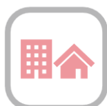
賃貸・持ち家比較

簡単な数値を入力するだけで、住宅購入時期やローン比較、賃貸との比較などがすぐにわかる豊富なシミュレーションが行えます。